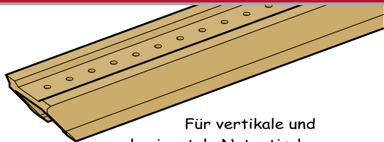
Für vertikale und horizontale Nutentische

Goldfarben eloxierte Aluminiumprofile mit abgeschrägten Extremitäten um den Ausbau zu erleichtern. Die Tischoberfläche ist völlig frei, was das Entfernen der Späne begünstigt. Das Reinhalten der Nuten und der Abfluss der Schmier- und Kühlmittel gewährleisten die Sicherheit des Betreibers.